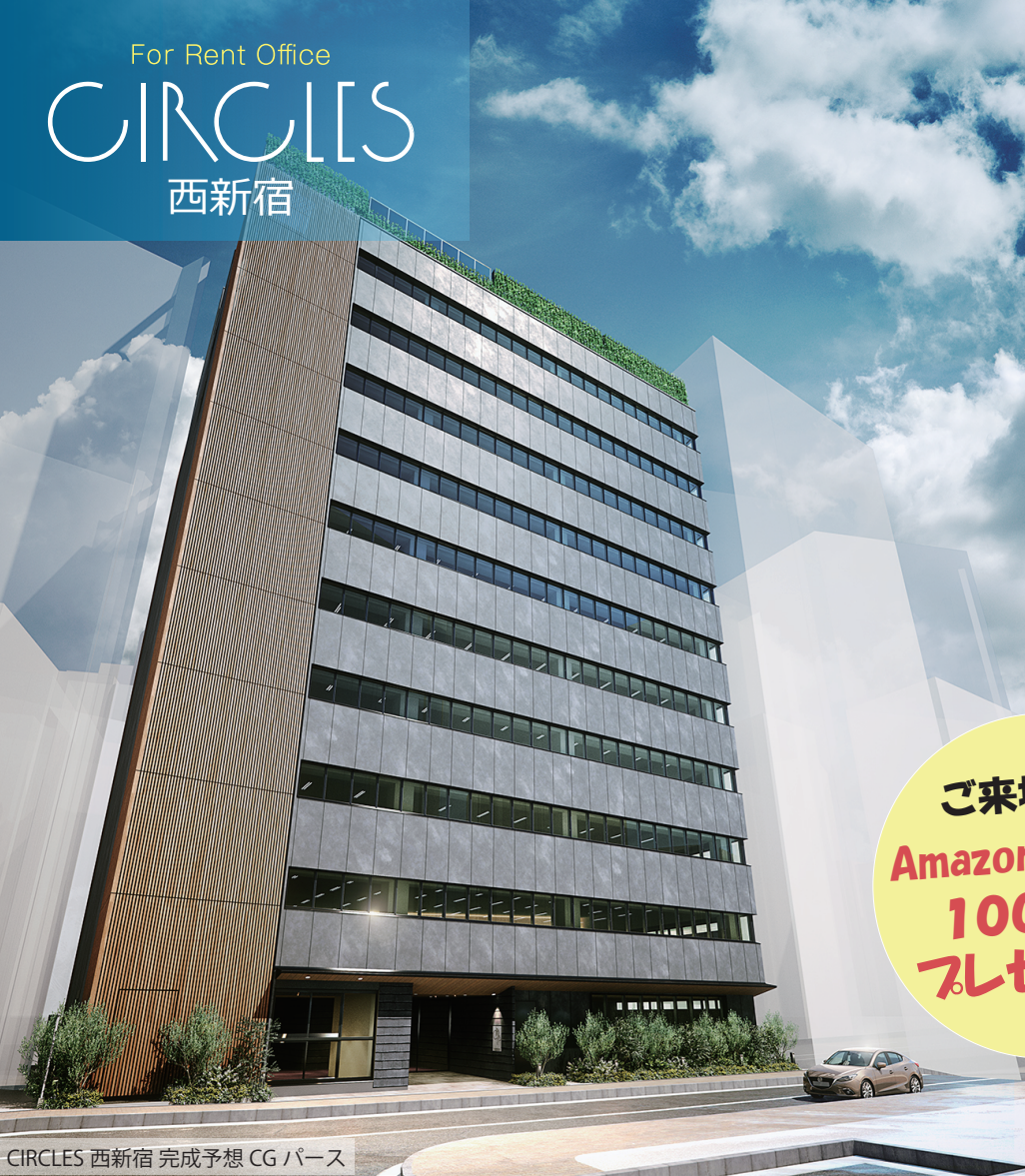
CIRCLES 西新宿 完成予想 CG パース