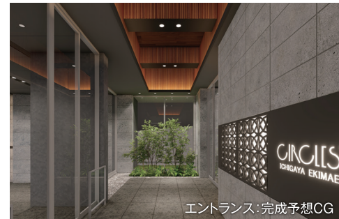
エントランス:完成予想CG