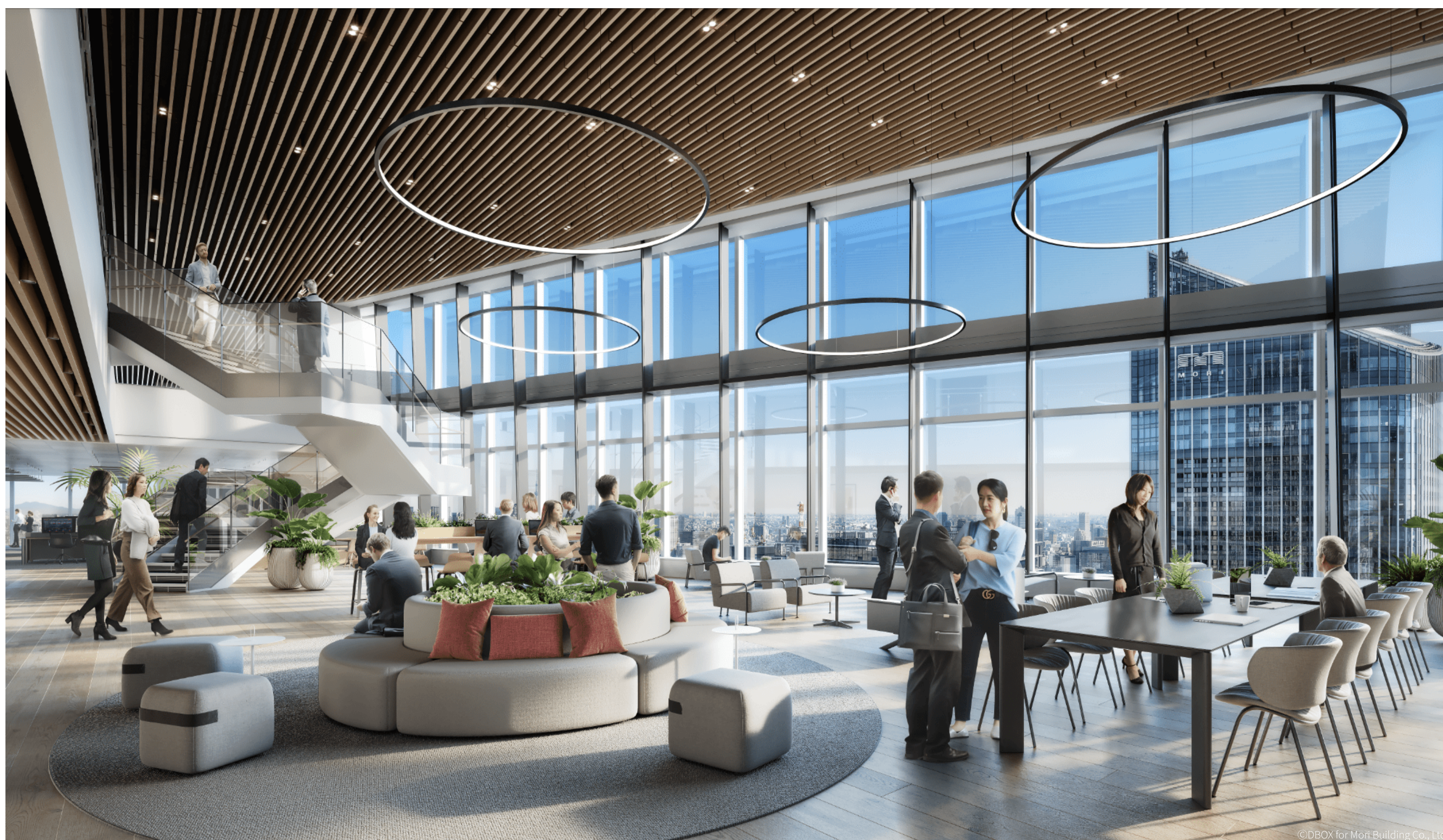
オフィス専有部にある2層吹き抜けのマグネットゾーン。ここでの“出逢い”が、イノベーションに繋がる意外性や違和感を創出する

ステーションタワーのオフィスは全32フロア、基準階の面積は約3,400平方メートル（約1,000坪）で、多様なニーズにも応えられるオフィス空間となっています。「これからのオフィスには、働く人のモチベーションを刺激し、出社したくなるような何かが求められる」と指摘する稲原氏。さらに、こう続けます。