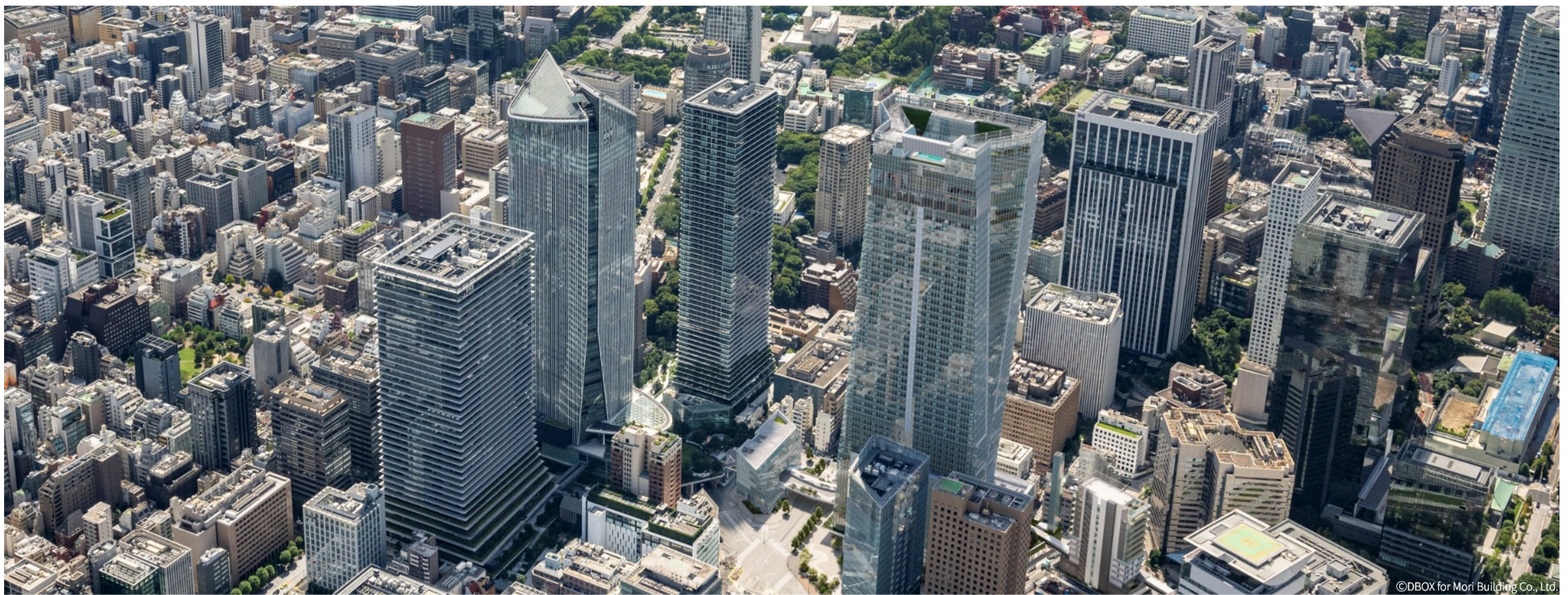
虎ノ門ヒルズを象徴する4つの超高層ビル。街づくりの最後のピースとなるステーションタワーは2023年の秋に完成する予定

経済や政治の面から東京をリードしてきた港区虎ノ門。その一角に、「国際新都心・グローバルビジネスセンター」を標榜する虎ノ門ヒルズがあります。ヒルズ内にある「森タワー」の2階に入ると、白色のネコ型ビジネスロボット「トラのもん」が出迎えてくれます。「ドラえもん」と同じ工場で作られたというこの虎ノ門ヒルズ公式マスコットは、社会にイノベーションの波を引き起こす“ビジネスの種”を探しに、22世紀の社会からタイムマシンに乗って虎ノ門ヒルズを訪れています。「トラのもん」の四次元ポケットの中には東京のこれからを切り拓く“未来の道具”が詰まっているそうです。