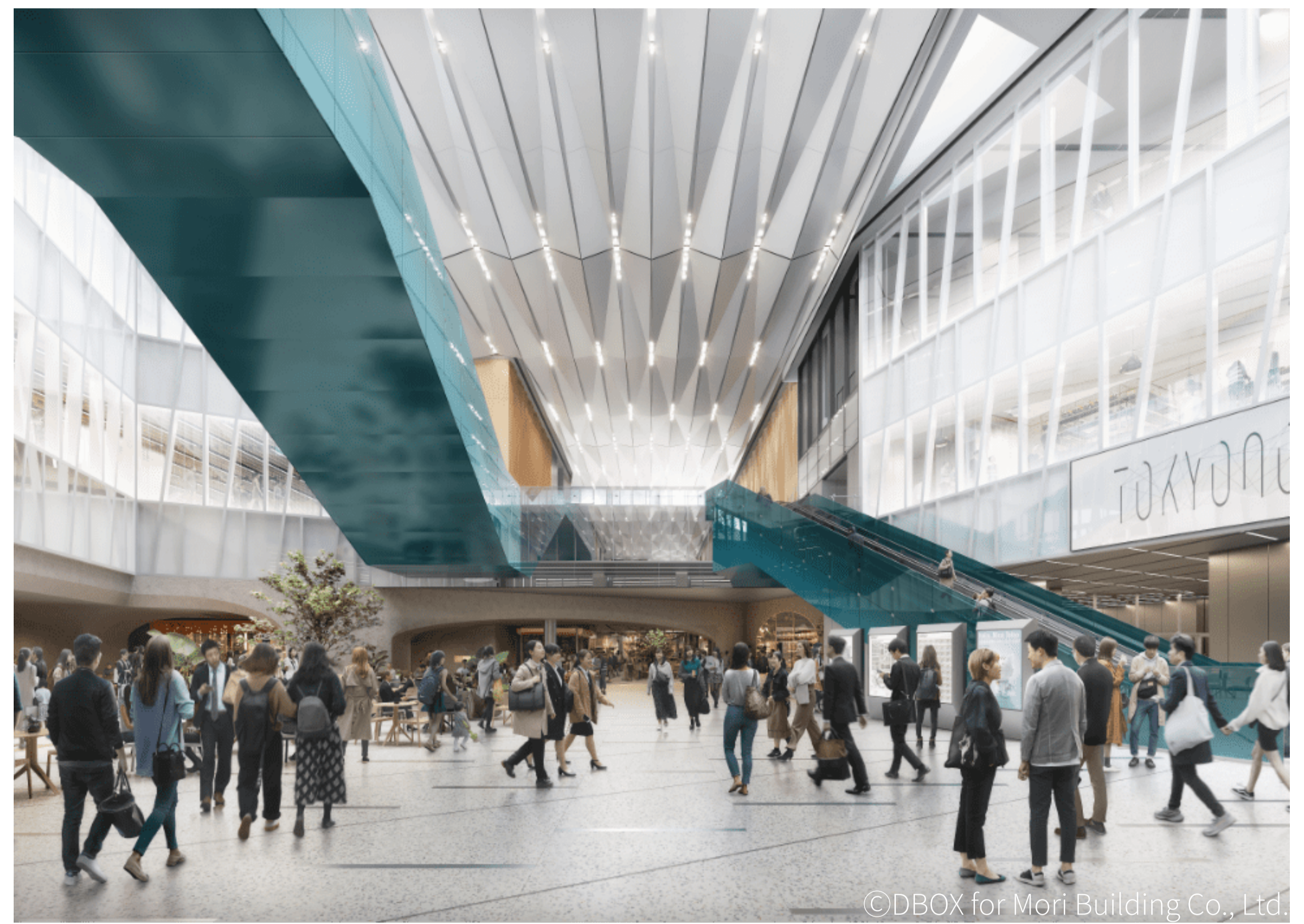
地下鉄「虎ノ門ヒルズ駅」の駅前広場「ステーションアトリウム」。電車を降りて改札を出ると目の前に広がり、昼夜問わず賑わいを見せる