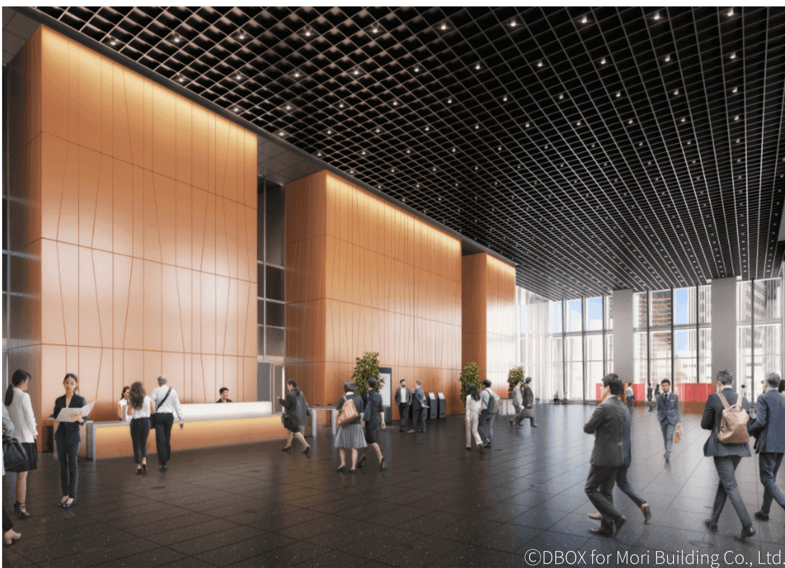
天井高10m、広さ約1,200㎡と、開放感のあるスカイロビー。「虎ノ門ヒルズ駅」に直結する地下2階の駅前広場や1階エントランスからダイレクトにアクセスが可能