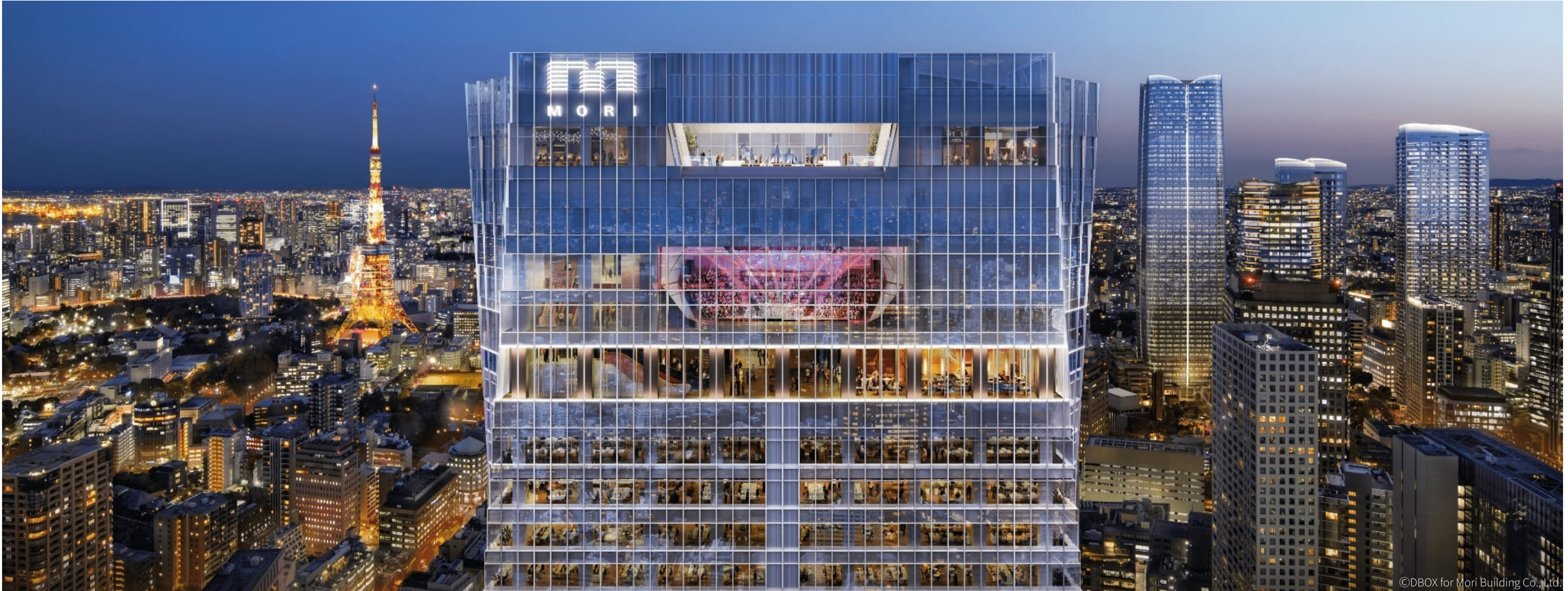
最高層階にある情報発信拠点「TOKYO NODE」。最先端の設備に加え、インフィニティ・プールやレストランなどが設置され、華やかかつ独創的な空間になっている

情報が溢れる現代社会において、拡散力が強く即時性のある“伝わる情報発信”は、企業が継続的に成長するうえで欠かせません。