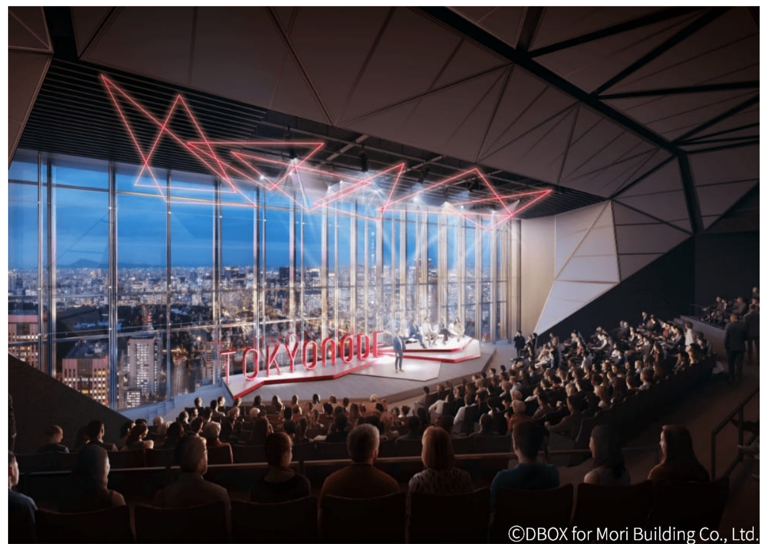
46階にある「TOKYO NODE」のメインホール。皇居を望む東京の眺望を背景に、多様なパフォーマンスやプレゼンテーションが開催される