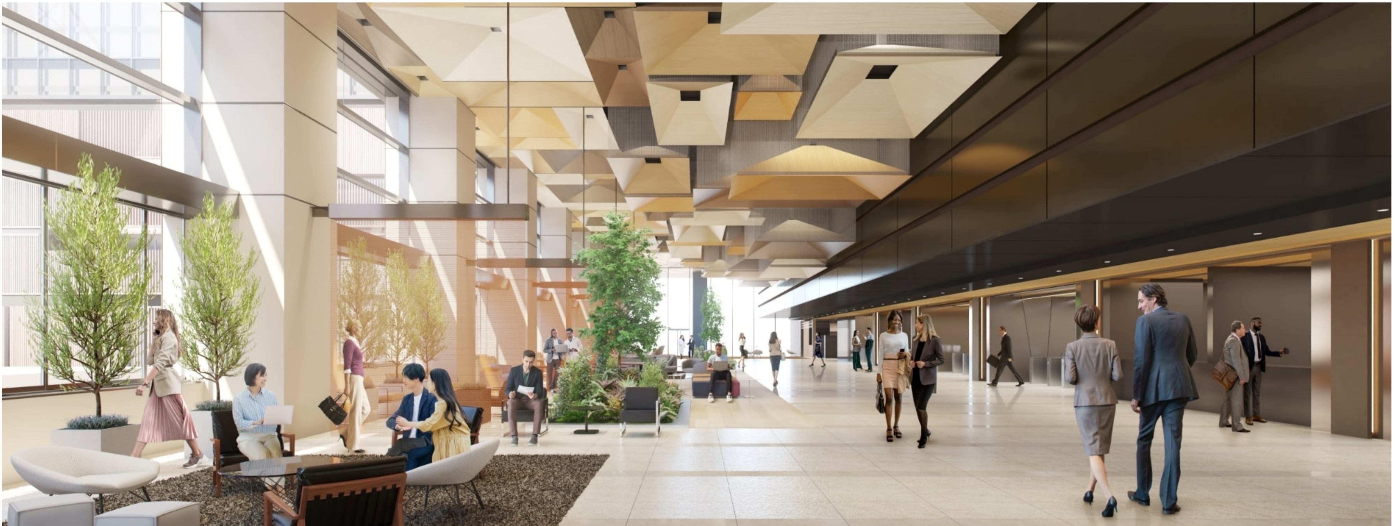
幾何学的なデザインの天井が際立つ、未来感と温かみが調和する洗練されたオフィスロビー

心身ともに健康に過ごせることは、従業員の満足度を向上させる大切な要素でもあります。ここまでご紹介したTOFROM YAESU TOWERの“体験”や“空間”は、従業員のウェルビーイングを促進できますが、その基盤となるのは何よりも、日々を安心・安全に過ごせる建物自体の性能です。