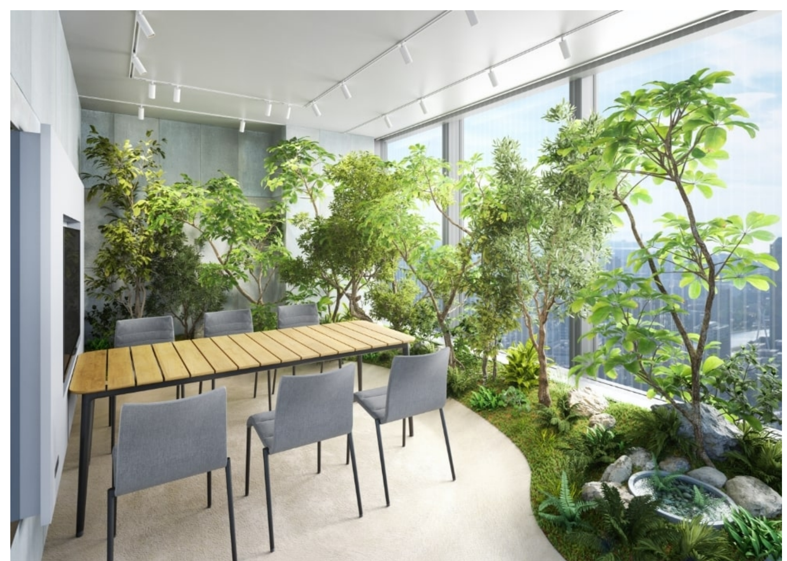
東京を一望しながら、自然の癒しを感じられる「緑の会議室」。働く人々の発想力を刺激し、心に安らぎをもたらす特別な会議空間