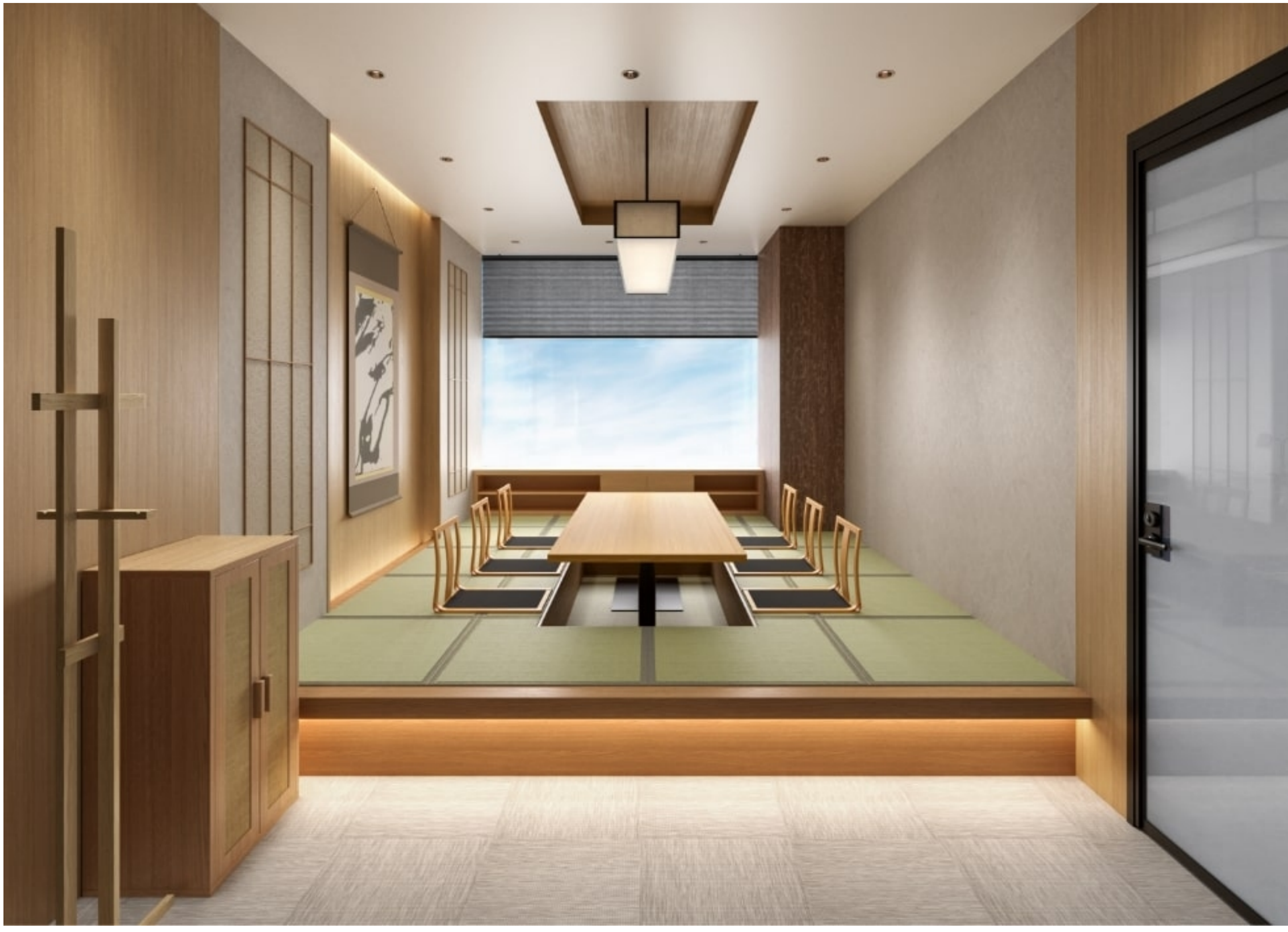
日本の精神性を未来に受け継ぐ「お茶の会議室」。お茶を通じて心身のリフレッシュとコミュニケーションの活性化を促す