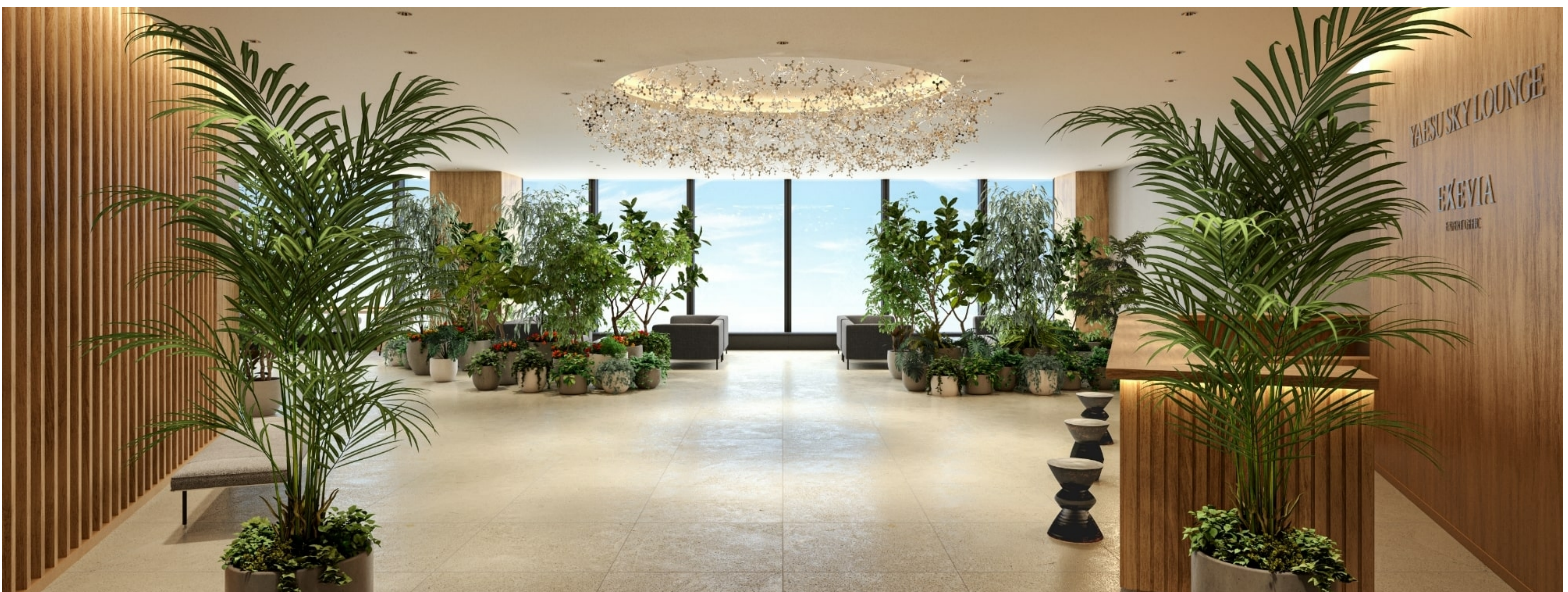
地上約190m、緑に囲まれた「YAESU SKY LOUNGE」。心と体を癒やし、働く人々に新たな活力をもたらすウェルビーイングの拠点