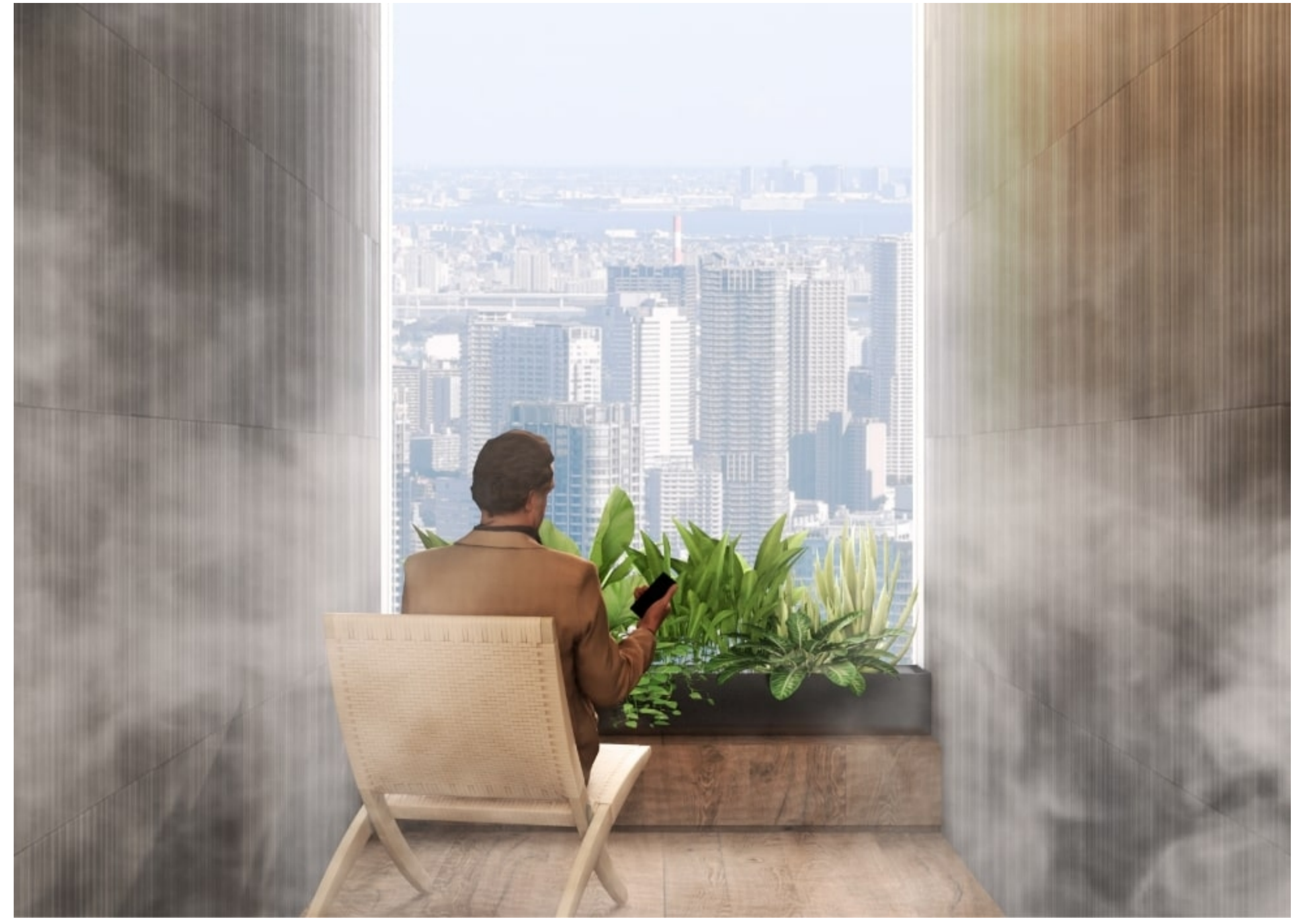
湯治の癒しをオフィスに取り入れた「喫泉室」。隙間時間を活用して心身をリフレッシュできる新しいウェルビーイング体験