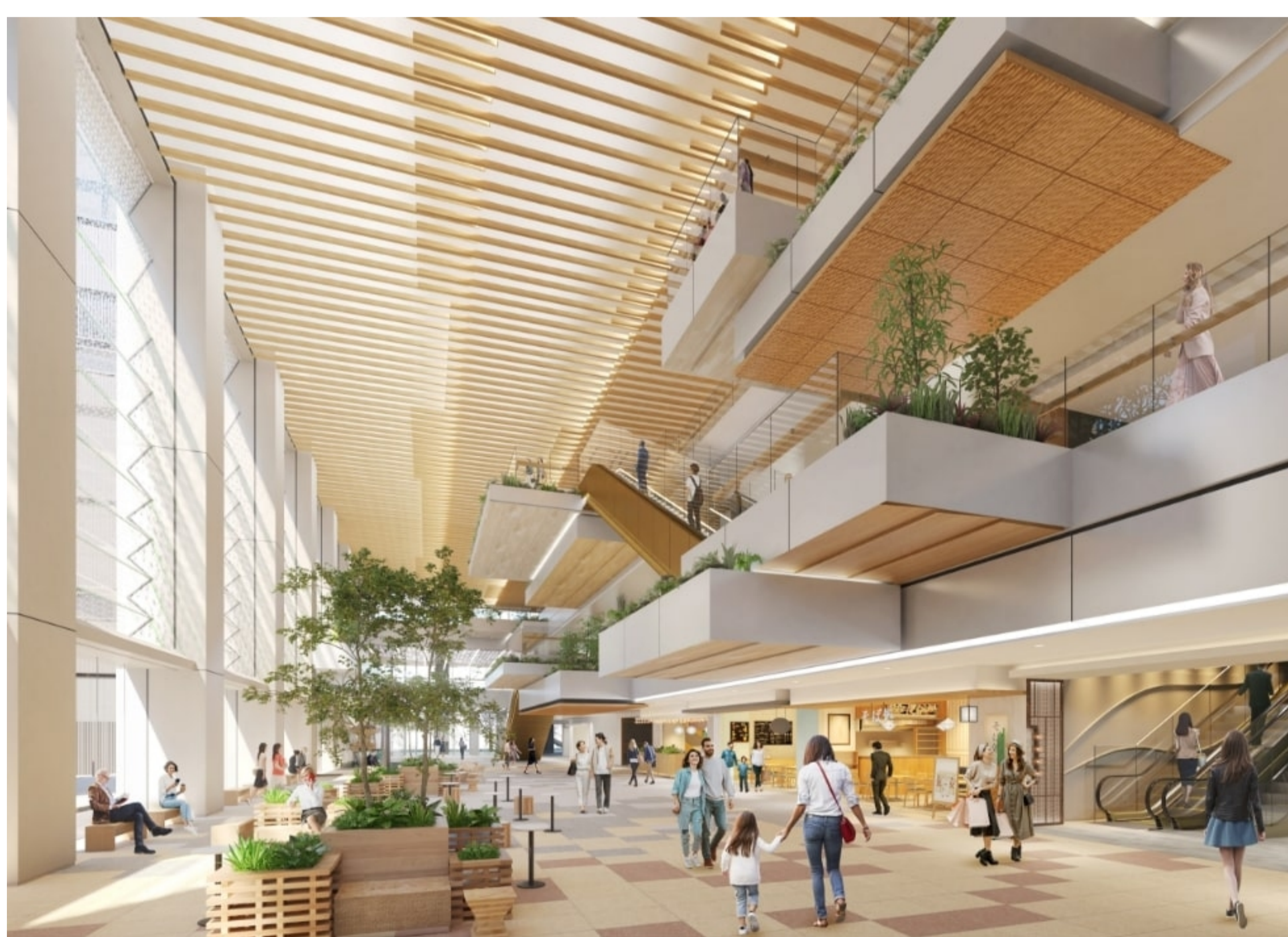
1階に位置する屋内広場「檜物町スクエア」。多彩なイベントやアクティビティを通じて、人と街、ビルをつなぐ八重洲の新たな交流拠点を目指す

多様な空間が整備されたTOFROM YAESU TOWER。数多くの選択肢を組み合わせながら、企業独自の働き方を構築することで、組織全体のポテンシャルを最大限に引き上げてくれるはずです。